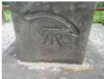
迷子石の几号水準点

外堀通りを右に曲がったところが一石橋。この橋の南詰西側に迷子石がある。「しらすの方」と「たつぬる方」とが両側に刻まれており、江戸時代の迷子の告知板だそう。この石標の正面に「満よい子の志るへ」(迷い子のしるべ)とあり「へ」の下に几号「不」が鮮明に刻まれてある。