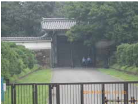
ゲートの先の半蔵門