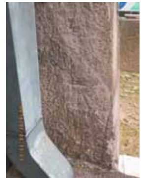
大手門 外門右側の几号

次に内堀通りを南へ、東京駅正面からまっすぐ皇居に向かう凱旋通りのお真ん中を通り、日比谷通りを日比谷公園に向かう