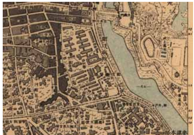
仮製一万分一「四谷」明治43年 日本帝国陸地測量部・発行(部分)

AGC レポート vol-52 2014年8月25日発行 発行: 日本山岳会・山岳地理クラブ(代表・北野忠彦) 〒102-0081 東京都千代田区四番町5-4 日本山岳会 気付 TEL 03-3261-4433 FAX 03-3261-4441 編集担当: 近藤 E-mail: info@hikarikon.com