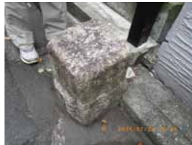
大京町の几号独立標石

この先、予定通り新宿に向かうか、このあたりまでで今日はおしまいとするか、多少意見の分かれるところであったが、とにかくもう一つ残った几号水準点を確認してから決めようということになり、新宿御苑南端、大京町路傍の独立標石に向かった。これは上西氏のHPに記されていた標石で、20cm四方、高さ20cmの花崗岩の上面にはっきり几号標が刻まれているものだ。地理寮雑報に記されている独立標石で「青山六道辻」にあったものが何かの理由で移動したものではないかと氏は推察している。