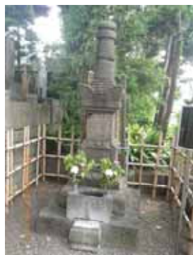
西念寺・服部半蔵の墓

すこし英気が戻ったところで、同行の高橋嬢に地元界限の案内をお任せ。西念寺の服部半蔵の墓や四谷怪談の於岩稲荷などを見学。四谷の地名は四つの谷があったことからののか、四つの家があった事からののか、2つの説があるようだと言う。