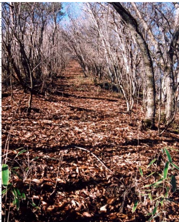
余地峠から1337.4m峰への途中