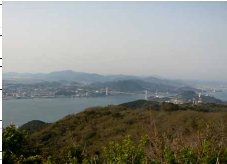
風師山より関門海峡を隔てた火の山方面