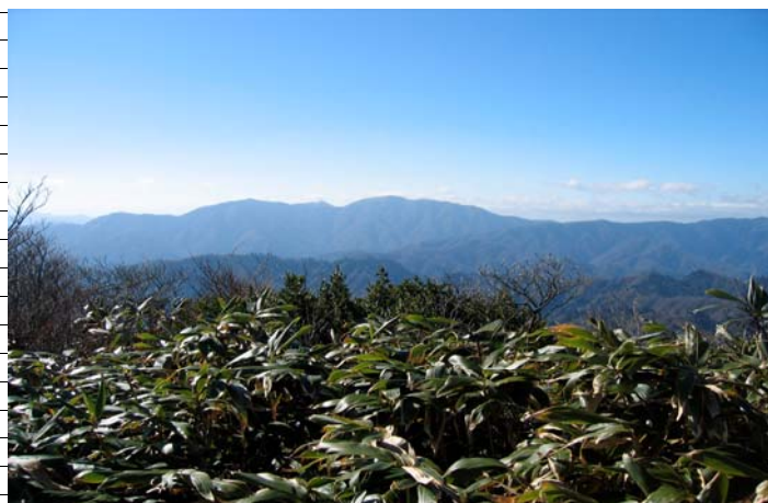
能郷白山(屏風山頂上から)