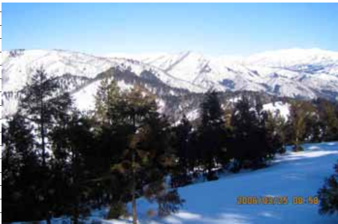
P1166付近の稜線からの西山・毘沙門岳方面の遠景(132KB)