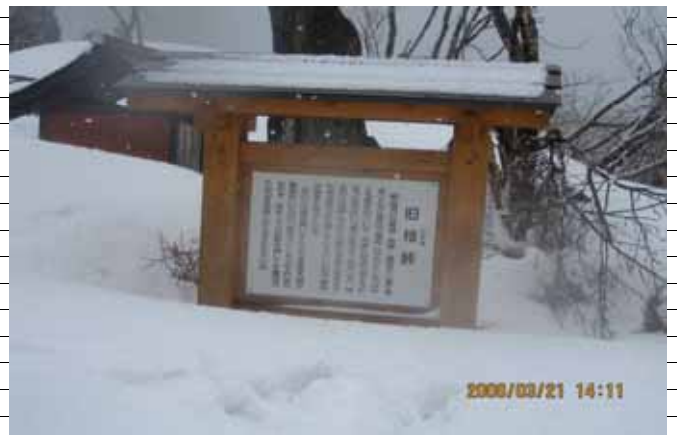
旧松崎に建てられている説明着板(06/03/23に同一メジャーで反対の県境歩きの際、下山に利用時撮影)(109KB)